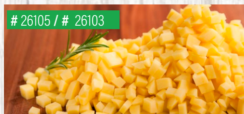
Kartoffelwürfel, 1 x 1 cm, 10 kg Kartoffelwürfel, 2 x 2 cm, 10 kg