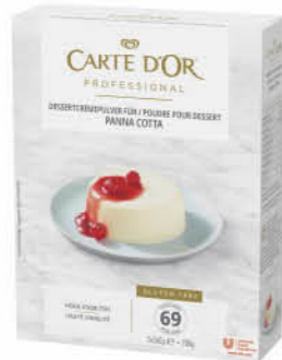
Carte D'Or Panna Cotta