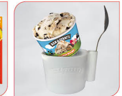
Ben & Jerry's Shortybecher (ohne Dekoartikel) Art.-Nr. 36 010 VE: 6 Stück Preis: € 28,00