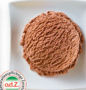
Schokolade Eis mit Schokoladengeschmack