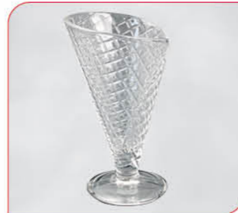
Gelato Art.-Nr. 37 100 Größe: H 17 cm, Ø 9,5 cm VE: 12 Stück à 210 ml Preis: € 29,00