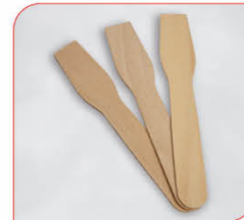
Holzspateneislöffel Art.-Nr. 37 451 VE: 1.000 Stück Preis: € 11,00