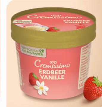
Cremissimo Becher Erdbeer Vanille Cremiges Vanille- und Erdbeereis in der perfekten Snackgröße