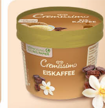
Cremissimo Becher Eiskaffee Cremiges Kaffee- und Vanilleeis in der perfekten Snackgröße