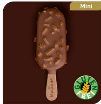
Magnum Mini Mandel Lecker Vanilleeis umhüllt von knackiger Milkschokolade mit Mandelstückchen

Sofort einsetzbar und individualisierbar mit Früchten, Saucen und Toppings