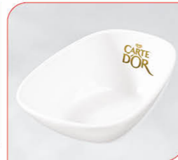
Eisschale Carte D'Or Art.-Nr. 36 160 Größe: L 13 cm, B 10 cm, H 4 cm VE: 4 Stück Preis: € 10,00