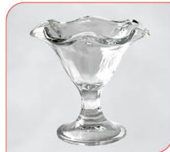
Flora Art.-Nr. 38 717 Größe: H 14 cm, Ø 13 cm VE: 12 Stück à 240 ml Preis: € 27,00