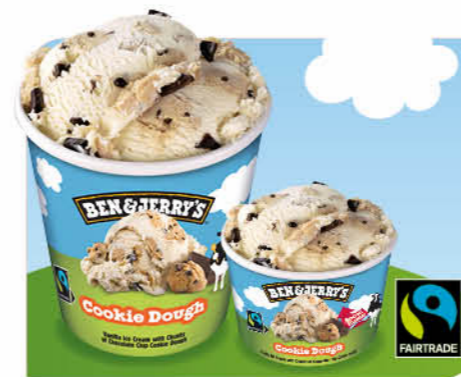
Cookie Dough Vanille-Eiscreme, Cookie-Teig-Stückchen, kakaohaltige Chunks