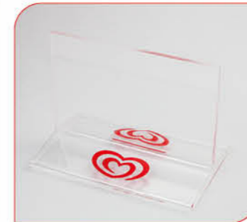
Tischaufteller und Eiskartenhalter aus Plexiglas Art.-Nr. 36 125 VE: 10 Stück Preis: € 30,00