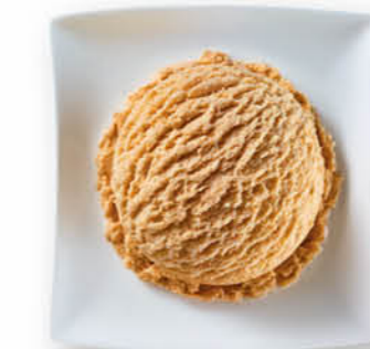
Kaffee Eis mit Kaffeegeschmack