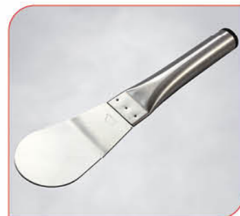
Eisspatel Art.-Nr. 36 552 VE: 1 Stück Preis: € 21,00