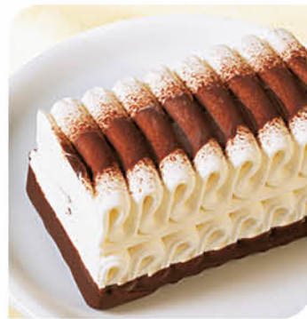
Mini Viennetta Vanilla Eis mit Vanillegeschmack, von feinen schoko-braunen Knisper-schichten durchzogen