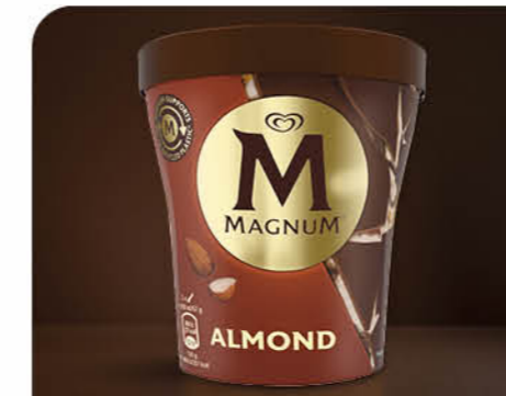
Mandel Vanilleiscreme mit Milkschokoladenstückchen, Mandelstiften und einer knackigen Milkschokoladenhülle.