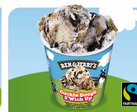
Cookie Dough S'Wich Up Vanille-Eiscreme, gefüllte Kakao-Doppelkekse, Cookie-Teig-Stückchen, kakaohaltiger Keksstrudel