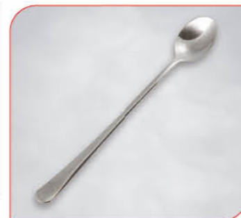
Eislöffel Schneller Schlemmer Art.-Nr. 36 017 Größe: L 19,5 cm VE: 12 Stück Preis: € 24,00