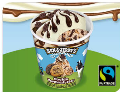
Sundae Cookie Vermont-ster

Gesalzene Karamell-Eiscreme, Karamell-Chunks und -sauce, Schokoladenmilch-Topping