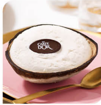
Kokosnuss Exotisches Kokosnusseis, servierfertig angerichtet in einer halben Kokosnussschale