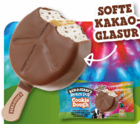
Cookie Dough Peace Pop

Vanille-Eiscreme, Kern aus Cookie-teig, überzogen mit kakaohaltiger Fettglasur mit gezuckerten Kakaostückchen