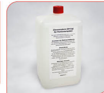
Zitronensäure Art.-Nr. 38 199 VE: 1 Stück à 2 Liter Preis: € 14,00