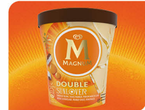
Double Sunlover Kokoseiscreme mit weißen Schokoladenstückchen verstrudelt mit Mango-Passionsfruchtsauce, umhüllt mit weißer Schokolade und bestreut mit Mango- und Kokosstückchen.