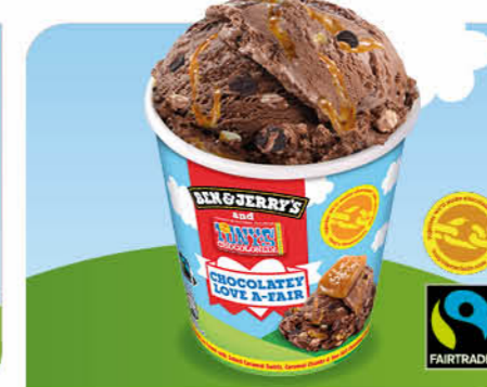
Chocolatey Love A-Fair Schokoladen-Eiscreme, kakaohaltige Chunks, gesalzene Karamellsauce und -stückchen