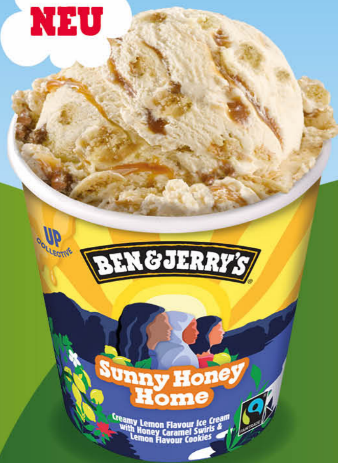
Sunny Honey Home Eiscreme mit Zitronengeschmack mit Honig-Karamell-Swirls und Zitronen-Cookie-Chunks