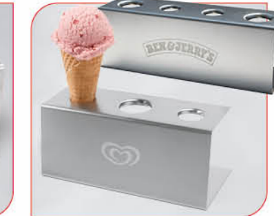
Waffeltütenhalter aus Edelstahl Art.-Nr. Langnese 38 630 Art.-Nr. Ben & Jerry's 38 633 VE: je 1 Stück Preis je Stück: € 28,00