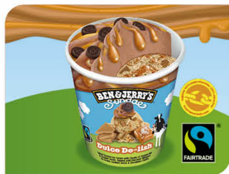
Sundae Dulce De-lish

Gesalzene Karamell-Eiscreme, Karamell-Chunks und -sauce, Schokoladenmilch-Topping