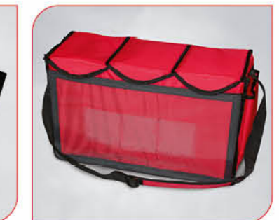
Hawking Bag Eisverkaufstasche Art.-Nr. 50 001 Größe: H 32 cm, B 53 cm, T 22 cm VE: 1 Stück Preis: € 41,00