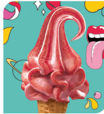
Erdbeer Eis mit Erdbeergeschmack und Erdbeersauce (15%)