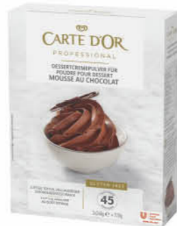
Carte D'Or Mousse au Chocolat

Weitere Produkte auf www.unileverfoodsolutions.de