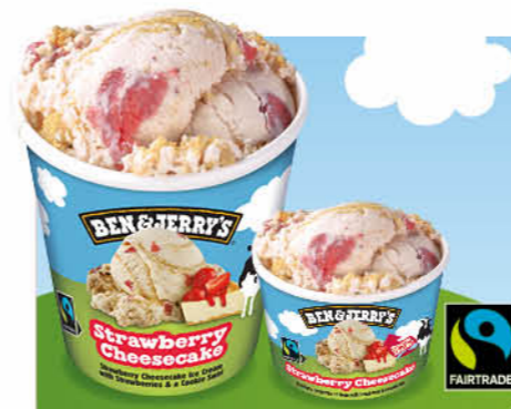
Strawberry Cheesecake Erdbeer-Käsekuchen-Eiscreme, Erdbeerstücke, Keksstrudel