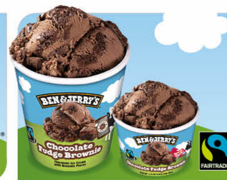
Chocolate Fudge Brownie Schokoladen-Eiscreme, Brownie-Gebäckstückchen