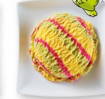
Schmeckerfatz Birneneis, Eis mit Vanille- geschmack und Erdbeersauce