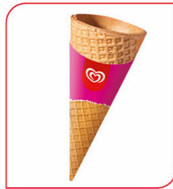
Waffeltüte für Soft- und Portioniereis**