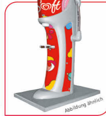
Langnese Soft Dispenser** Für Kombiverkauf aus der Impulseisruhe