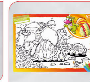
Malschmeckerfatz Art.-Nr. 36 251 Größe: B 42 cm, H 30 cm VE: 100 Stück Preis: € 16,00