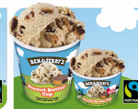
Peanut Butter Cup Erdnussbutter-Eis, Erdnussbutter-Drops mit kakaohaltiger Fettglasur überzogen