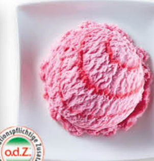
Erdbeer Eis mit Erdbeergeschmack mit Erdbeersauce (21%)