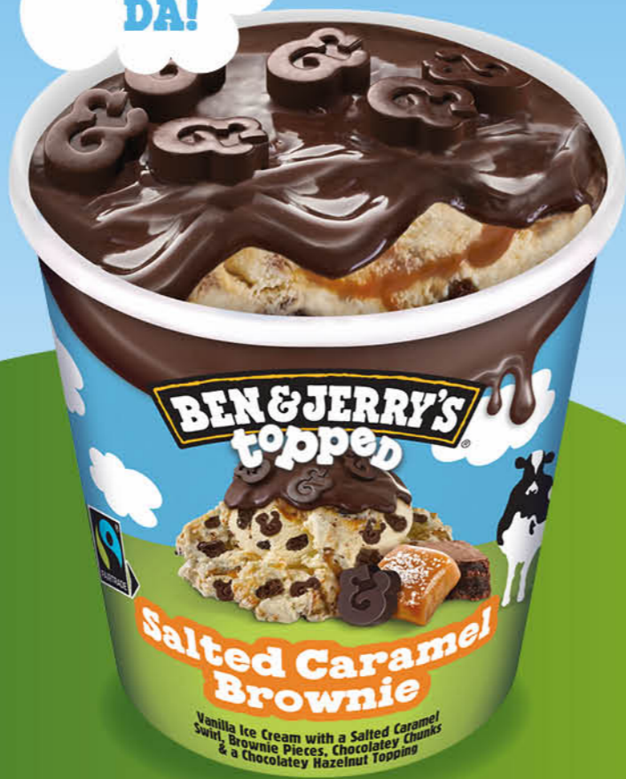
Topped Salted Caramel Brownie Vanille-Eiscreme mit gesalzenen Karamell-Swirls, Brownie-Gebäckstückchen, kakaohaltigen Fettglasurstückchen und Schokosaucen-Topping