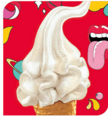
Vanilla Eis mit Vanillegeschmack

Biete Deinen Gästen ein ganz besonderes Eis-Erlebnis : Einzelportioniert und mit Toppings individualisierbar.