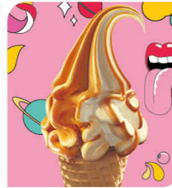
Vanilla & Caramel Eis mit Vanillegeschmack, Eis mit Karamellgeschmack und Karamellsauce (12%)