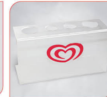
Waffeltütenhalter aus Plexiglas Art.-Nr. 38 628 VE: 1 Stück Preis: € 12,00