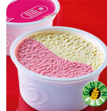
Eisbecher Erdbeer Vanille Eis mit Vanille- und Erdbeergeschmack