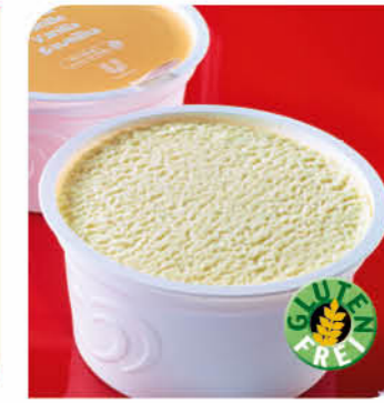
Eisbecher Vanille Eis mit Vanillegeschmack