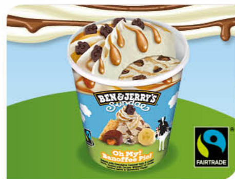
Sundae Oh My! Banoffee Pie!

Cookie-Eiscreme, Schokoladenstückchen, Schokokek-Strudel, Eiscreme-Topping