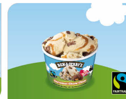
Caramel Chew Chew Karamell-Eiscreme, Karamellsauce, Karamelldrops mit kakaohaltiger Fettglasur überzogen