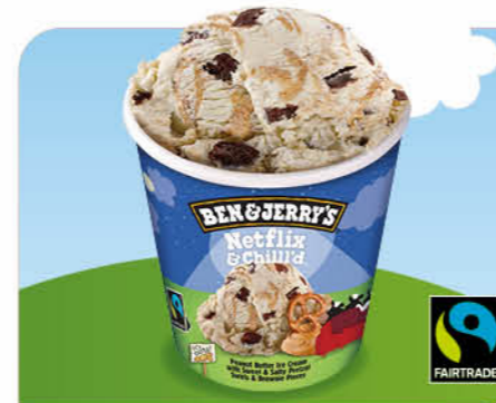
Netflix & Chill'd Erdnussbutter-Eis, Brezel-Swirl, Brownie-Gebäckstückchen