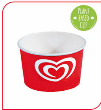
Langnese Portionsbecher* Art.-Nr. 39 500 VE: 100 St. à 175 ml Preis: € 8,00 Art.-Nr. 39 805 VE: 1.000 St. à 175 ml Preis: € 76,00