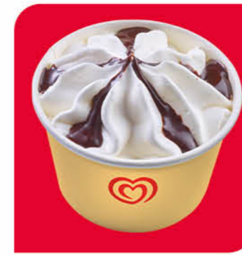
Langnese Becher Vanilla-Schoko Eis mit Vanillegeschmack und Schokoladensauce