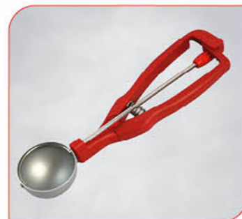
Outdoor-Portionierer 16stel: 37 079 40stel: 38 580 20stel: 38 571 VE: 1 Stück 30stel: 38 318 Preis: € 24,00