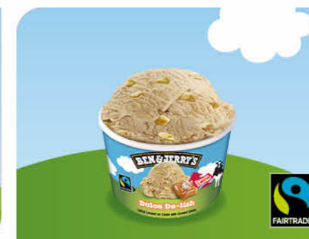
Dulce De-lish Gesalzene Karamell-Eiscreme mit gesalzenen Karamellstückchen