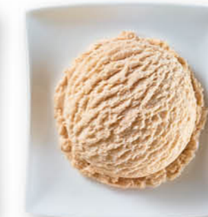
Haselnuss Eis mit Haselnussgeschmack