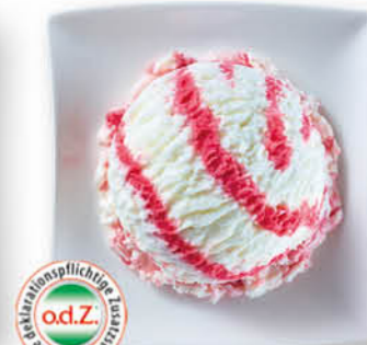
Joghurt-Himbeer Eis mit Joghurt und Himbeersauce (23%)