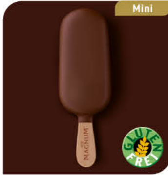
Magnum Mini Lecker Vanilleeis mit einem knackigen Milkschokoladenüberzug