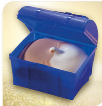
Schmuggerkiste Eine Kiste gefüllt mit Schokoladeneis und Eis mit Vanillegeschmack. Mit kleiner Überraschung