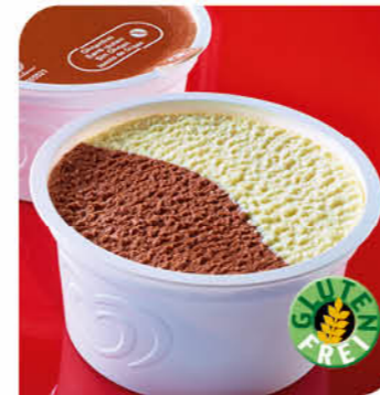
Eisbecher Schoko Vanille Eis mit Vanillegeschmack und Schokoladeneis