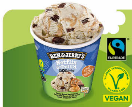
Netflix & Chill'd

Veganes Karamell-Eis, Keksstrudel, Cookie-teig-Stückchen mit Schokoladenstückchen