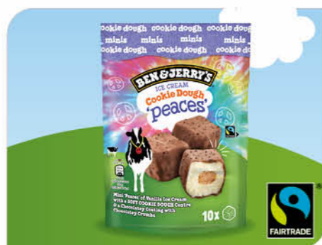
Cookie Dough Peaces

Cookie-teig-Stückchen mit Schokoladenstückchen, tiefgefroren