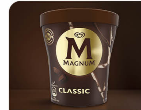
Classic Vanilleiscreme mit Milkschokoladenstückchen und einer knackigen Milkschokoladenhülle.

Eine erfrischende Komposition aus fruchtiger Zitroneneiscreme durchzogen von Himbeersauce, umhüllt von knackiger weißer Schokolade und einem Topping aus prickelnden Stückchen.