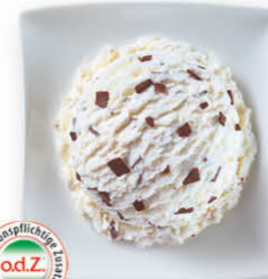
Stracciatella Eis mit Schokoladenstückchen (6%)