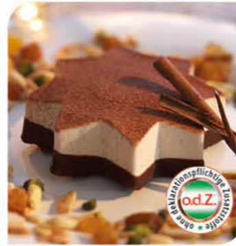
Zimteis-Stern Eine Komposition aus Zimt-Eiscreme mit einem Kern aus Bratapfeis, auf kakaohaltiger Fettglasur