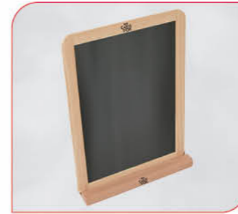
Carte D'Or Schiefertafel Art.-Nr. 36 105 Größe: DIN A4 VE: 1 Stück Preis: € 2,99