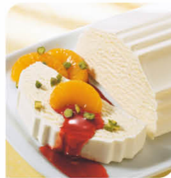
Eisrolle Vanilla Klassische Eisrolle aus Eis mit Vanillegeschmack