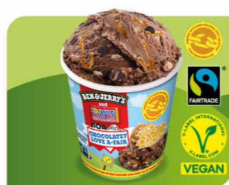
Chocolatey Love A-Fair

Veganes Erdnussbutter-Eis, Brezel-Swirl, Brownie-Gebäckstückchen