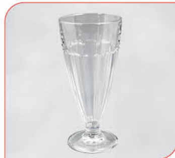
Eiskaffee Art.-Nr. 37 104 Größe: H 18 cm, Ø 8,5 cm VE: 12 Stück à 370 ml Preis: € 25,00