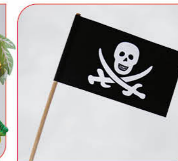
Piratenflagge Art.-Nr. 36 180 VE: 50 Stück Preis: € 3,50