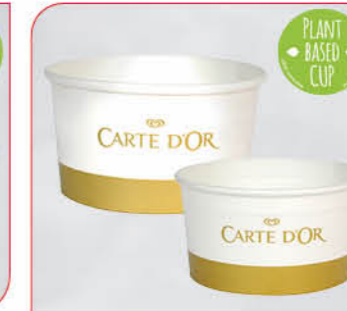
Carte D'Or Portionsbecher Art.-Nr. 50 000 VE: 630 St. à 195 ml Preis: € 55,00 Art.-Nr. 30 000 VE: 600 St. à 140 ml Preis: € 42,00