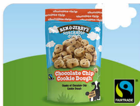
Chocolate Chip Cookie Dough Chunks

» Cremigere Textur » Verbesserter Geschmack » Keine Nuss-Zutaten