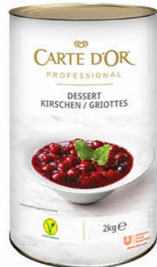
Carte D'Or Dessert Kirschen