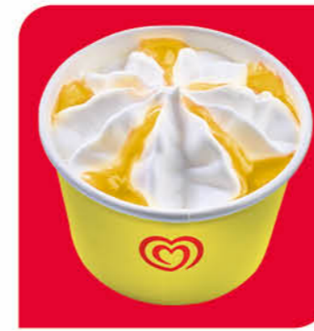
Langnese Becher Zitrone Eis mit Zitronengeschmack