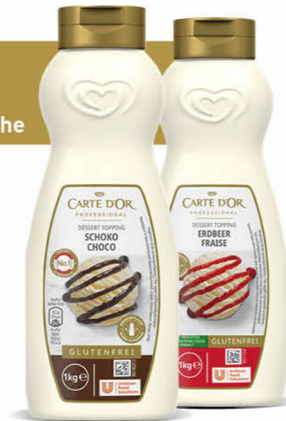
Carte D'Or Schoko Carte D'Or Erdbeer