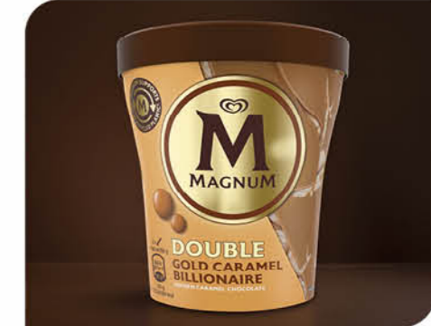
Double Gold Caramel Billionaire Feine Eiscreme mit Keksgeschmack und natürlich goldfarbenen Schokoladenstückchen, durchzogen von leckerer Toffee-Zimt-Sauce.