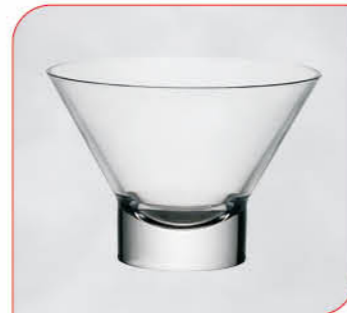
Ypsilon klar Art.-Nr. 36 019 Größe: H 9 cm, Ø 13 cm VE: 12 Stück à 375 ml Preis: € 21,00