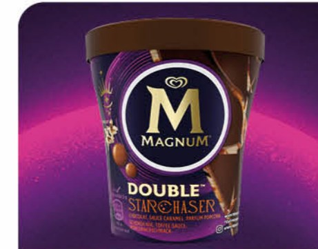
Double Starchaser Feine Eiscreme mit Popcorngeschmack, durchzogen von Toffee-Sauce, umhüllt von knackiger Milkschokolade und bestreut mit karamellisierten Maisstückchen.