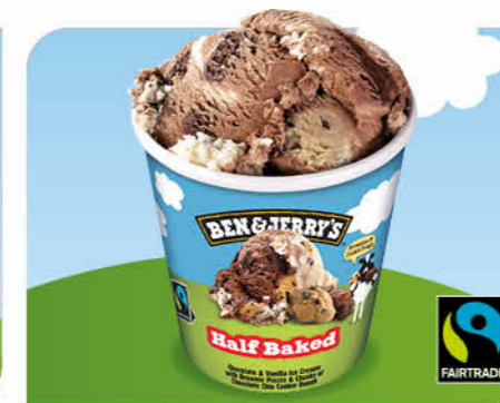
Half Baked Schokoladen-/Vanille-Eiscreme, Brownie-Gebäckstückchen, Cookie-Teig-Stückchen