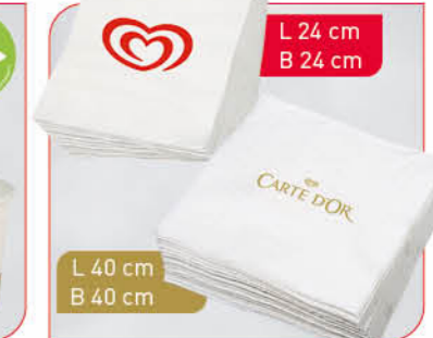
Servietten, zweilagig Art.-Nr. Langnese 36 102 Art.-Nr. Carte D'Or 36 590 VE: je 1.200 Stück Preis Langnese: € 23,00 Preis Carte D'Or: € 44,00