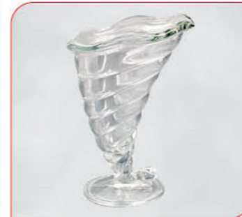
Fortuna Art.-Nr. 37 130 Größe: H 18 cm, Ø 12,5 cm VE: 12 Stück à 320 ml Preis: € 32,00