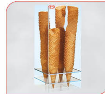
Waffeltütenspender aus Acrylglas Art.-Nr. 38 050 Größe: H 55 cm, B 23,6 cm, T 23,3 cm VE: 1 Stück Preis: € 52,00