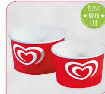
Langnese Portionsbecher Art.-Nr. 39 806 VE: 600 St. à 300 ml Preis: € 68,00 Art.-Nr. 39 805 VE: 1.000 St. à 175 ml Preis: € 76,00