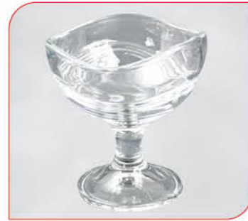
Acapulco Art.-Nr. 37 020 Größe: H 13 cm, Ø 12 cm VE: 12 Stück à 330 ml Preis: € 26,00

Jetzt bestellen! Diese und weitere Service Shop Artikel findest Du unter: unileverfoodsolutions.de