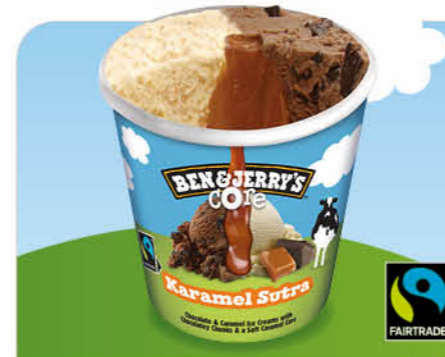
Karamel Sutra Schokoladen-/Karamell-Eiscreme, kakaohaltige Fettglasurstückchen, Karamellkern