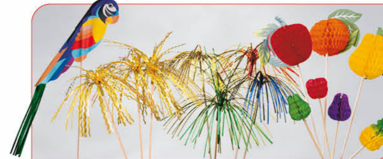
Eisdeko Papageien Art.-Nr. 36 330 VE: 100 Stück Preis: € 6,00 Glanzpalme Gold Art.-Nr. 36 265 VE: 576 Stück Preis: € 12,00 Glanzpalme Vulkan Art.-Nr. 36 269 VE: 500 Stück Preis: € 16,00 Eisdeko Früchtesticker Art.-Nr. 36 294 VE: 344 Stück Preis: € 12,00