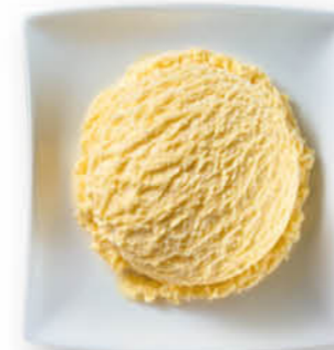
Vanilla Eis mit Vanillegeschmack