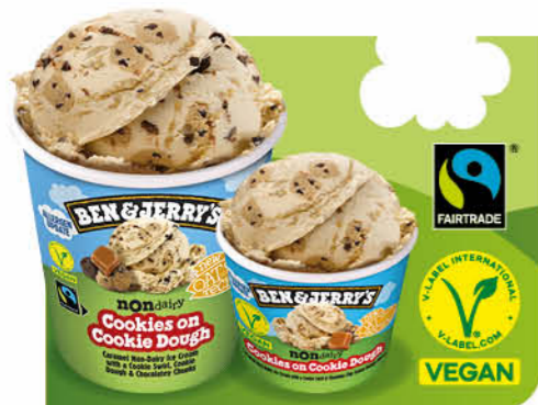
Cookies on Cookie Dough

Fruchteiscreme Banane, Karamelldrops, Keksstrudel, Eiscreme-Topping