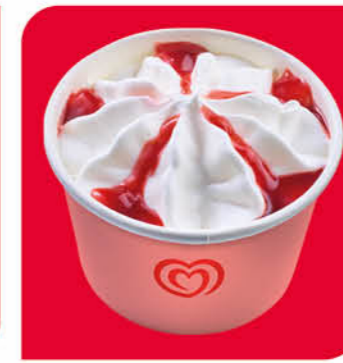
Langnese Becher Vanilla-Himbeer Eis mit Vanillegeschmack und Himbeersauce