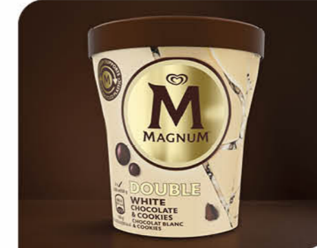
Double White Chocolate & Cookies Eiscreme mit weißen Schokoladenstückchen und einer Schokoladen-Kekssauce trifft auf knackige, weiße Schokolade und Keksstückchen.