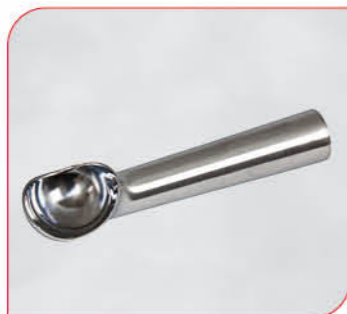
Dipper 20stel: 38 202 VE: 1 Stück 24stel: 38 210 Preis: € 18,00 30stel: 38 750