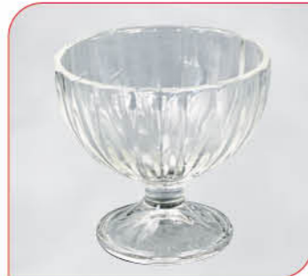
Alaska Art.-Nr. 37 025 Größe: H 9,5 cm, Ø 10 cm VE: 12 Stück à 265 ml Preis: € 13,00