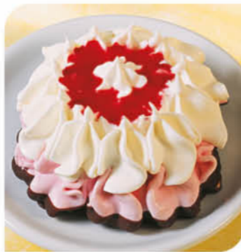
Royal Eistörtchen Erdbeer Kleines Törtchen aus Eis mit Vanillegeschmack, Eis Erdbeer und feiner Erdbeersauce