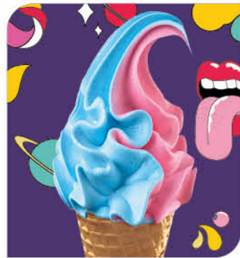
Galaxy Eis mit Kaugummigeschmack und Eis mit Himbeere