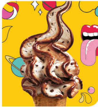
Stracciatella Eis mit Vanillegeschmack, Schokoladensauce (19%) und Schokoladenstückchen (4%)